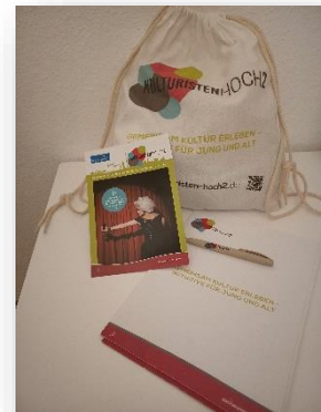
2 - erstes Werbematerial

Schnell fand das Projekt großen Zuspruch. Die Referatsleitung Kultur und Kreative Stadt, der Kulturausschuss der Stadt Kiel, der Seniorenausschuss, die Fachberatung der Kieler Schulen und mehrere kulturelle Einrichtungen begeisterten sich für KULTURISTENHOCH2 | Kiel und stimmten überein, das Projekt zu unterstützen.