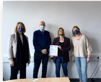
6 – Unterzeichnung der Ergänzungsvereinbarung im RBZ Wirtschaft. Kiel

Zeitgleich fragte das KULTURISTEN-Team Kiel das bestehende Interesse bei den Schulleitern der Projektschulen ab. So konnten wir sicherstellen, dass diese Schulen auch im nächsten Jahr mit an Bord sind. Es wurden jeweils Ergänzungsvereinbarungen unterzeichnet, mit der Klausel, das Projekt an den Schulen auf unbestimmte Zeit fortzuführen, bis eine Partei kündigt.