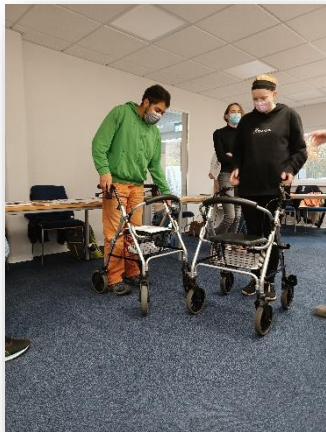
5 - SchülerInnen untersuchen die Rollatoren

Nun war es an der Zeit sich auch um den letzten und sehr wichtigen Bereich in unserem Projekt zu kümmern. Wir benötigten noch mehr Kulturpartner an unserer Seite. Hier zeigte sich aber schnell, dass die Bereitschaft, trotz der Pandemie Karten für unser generationenübergreifendes Projekt regelmäßig zu spenden, sehr groß war. Unser Team wollte die volle Bandbreite der Kieler Kulturlandschaft. Wir konnten es erreichen, dass auch das Theater Kiel sehr großzügig jeden Monat mehrere Karten spendet. Zudem konnten wir schon am Anfang unter anderem ein Kino, ein kleineres privates Theater, die Pumpe Kiel, die VHS – Kunstschule und das Holteinstadion für uns gewinnen.